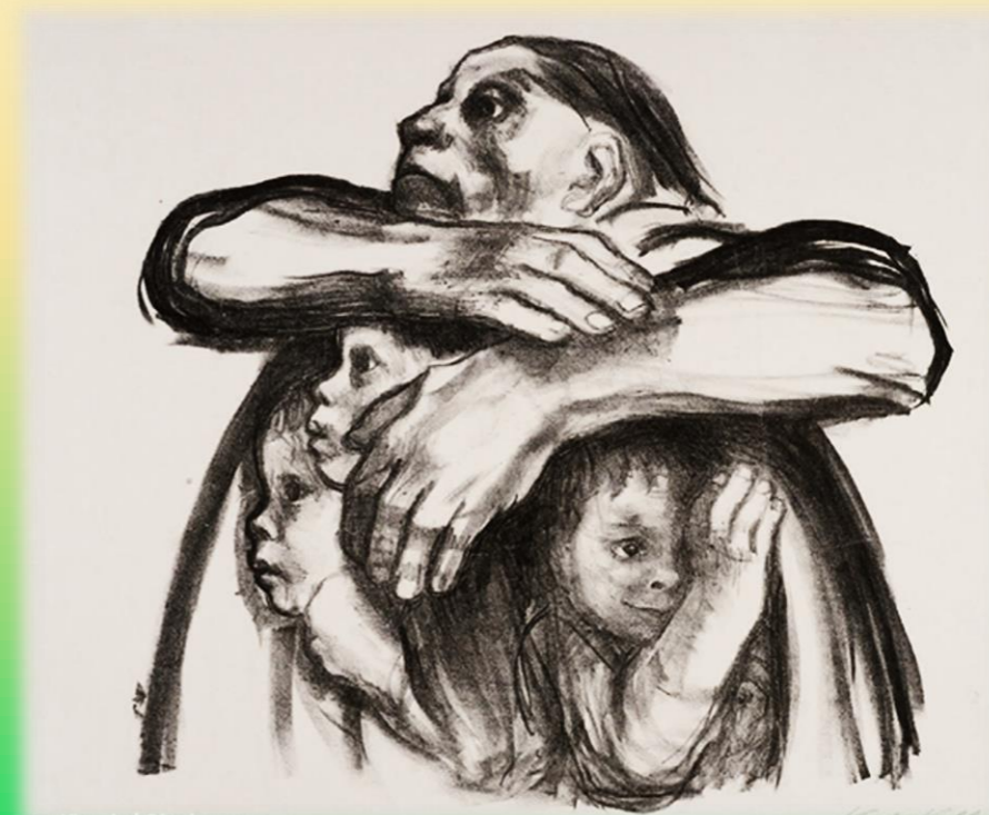
ケーテ・コルヴィッツ 「種子を粉に挽いてはならない」 1941年